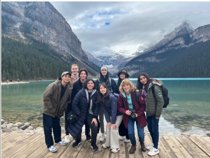
（一同去 Banff 的朋友們）

我覺得這趟加拿大交換之旅最大的收穫是『交到世界各地的朋友』，有來自法國、德國、澳洲、西班牙、南非、日本、韓國等國家的朋友們，從不了解異國的文化到漸漸了解，以及熟悉身邊朋友們他們國家的特色。其中，無庸置疑，英文扮演著非常非常重要的角色，我在學期間的 Reading week，和一群來自法國、澳洲、墨西哥、德國、日本、愛爾蘭等國家的朋友們一起開車去隔壁城市-Banff 遊玩，裡面只有我是台灣人，只有我會說中文，也代表著英文是我們大家唯一共同的語言。那五天四夜，我至今想起來都還是意猶未盡，大家各司其職，有的負責煮飯、有的負責洗碗、有的負責打掃，晚上大家再一起小酌玩遊戲，我也在那時學會了愛爾蘭朋友教我們的撲克牌遊戲。