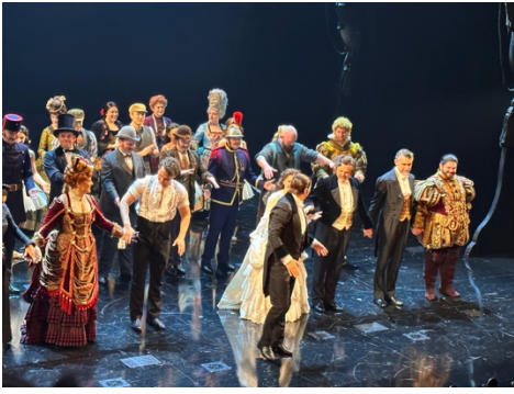
在英國看的歌劇魅影，大力推薦！