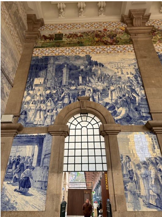
葡萄牙波多聖本篤火車站