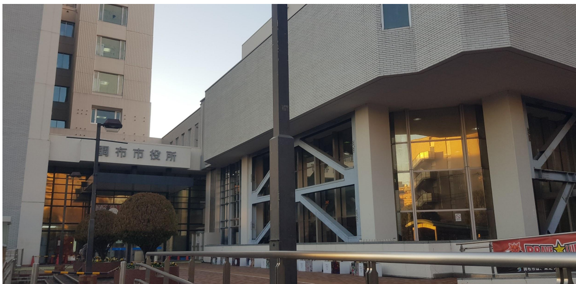
圖一、調布區役所辦理健保居住登記證等

同等級之下的日文課程難度排行： 漢字課<新聞日文<文法課<綜合日文 (主要是漢字對於台灣人過於簡單)