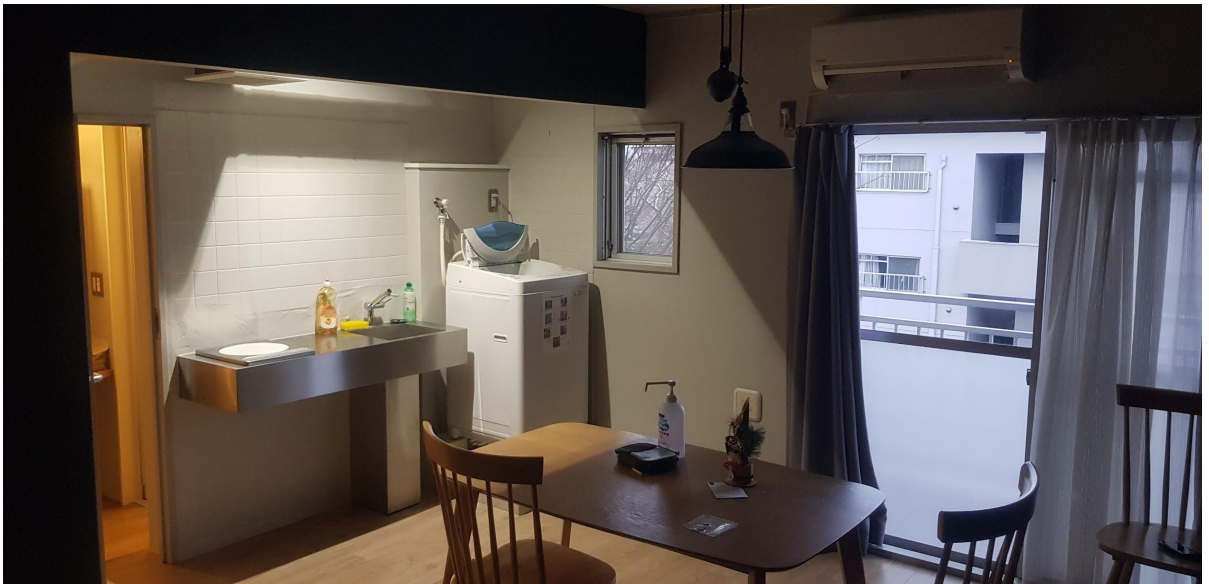
圖三、調布宿舍餐廳一隅